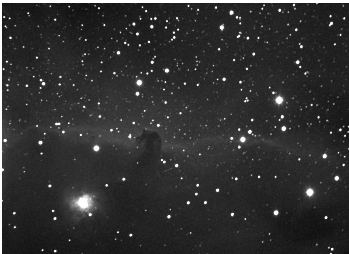
Рисунок 1 — Темная туманность Конская Голова на фоне светлой диффузной туманности

1) светлые и темные диффузные туманности, образованные межзвездным газом и пылью (рисунок 1);