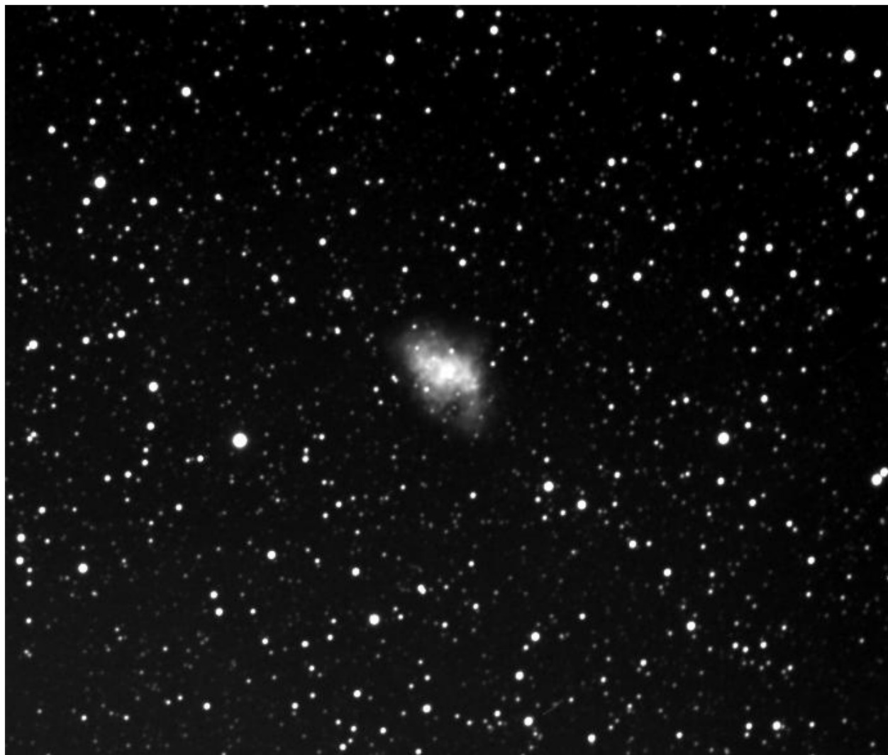
Рисунок 2 — Крабовидная туманность

2) планетарные туманности — сброшенные оболочки массивных звезд, израсходовавших запас термоядерного топлива в своих недрах (рисунок 2);