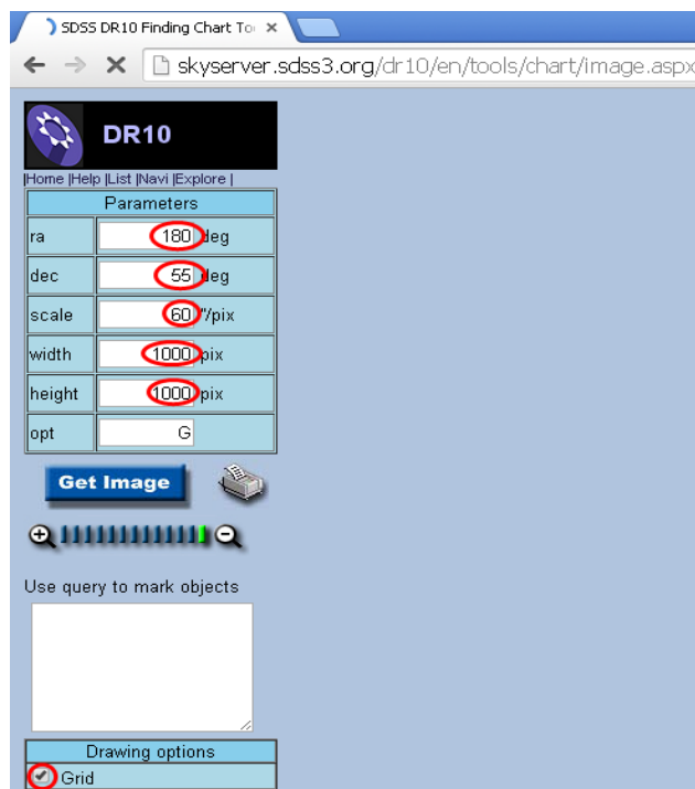
Рисунок 6 — Параметры для загрузки изображения Слоуновского цифрового обзора неба, предназначенного для выполнения данной лабораторной работы

2. В загрузившейся странице интерфейса доступа к звездным картам наберите прямое восхождение ra и склонение dec объектов из таблиц 1 и 2. Масштаб сначала возьмите самый маленький (рисунок 6), а потом увеличивайте его по необходимости.