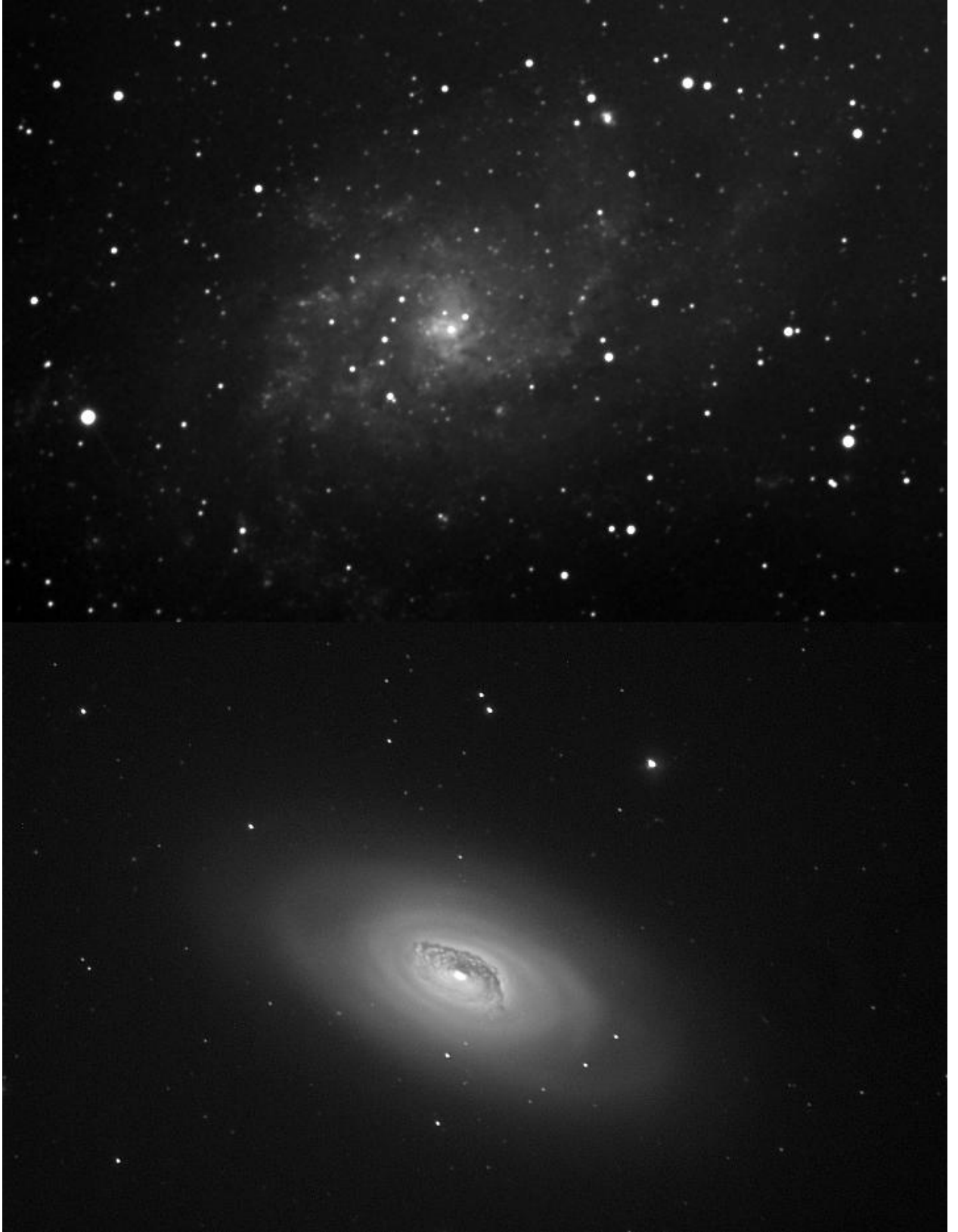
Рисунок 5 — Галактики М 33 (сверху) и М 64 (снизу)